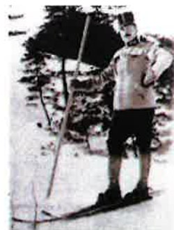
レルヒ少佐

幸せのウコン色に身を包み、一度見たら忘れられない凛々しい風貌。スキーが大好きなレルヒさんが大会を一緒に盛り上げます。