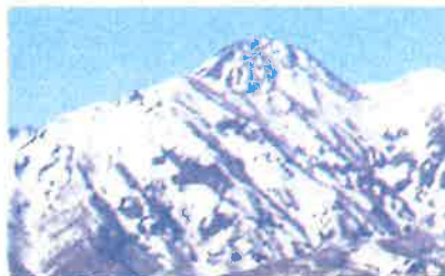
「はね馬」どこにあるかわかりますか?