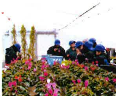
栽培の様子：高田農業高等学校

また、この地域で唯一の草花園芸コースがある高田農業高等学校で学ぶ生徒の皆さんが、愛情込めて育てた花々が式典のメインステージを飾ります。