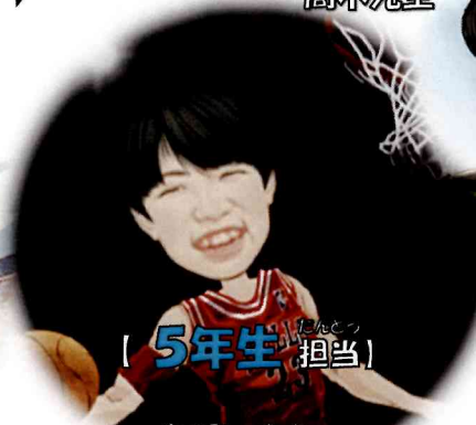
[ 5年生 担当 ]