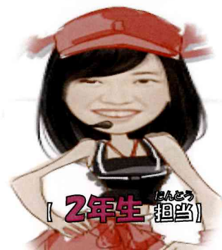
[ 2年生 担当 ]