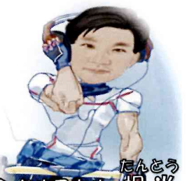
ガンダルスキル 担当