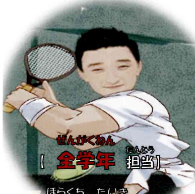
せんがくあん [ 全学年 担当 ]