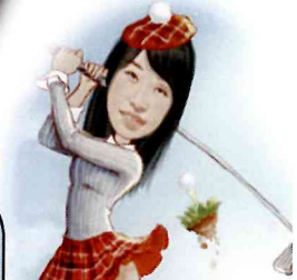
えいごかつどう ほんどう 英語活動 担当