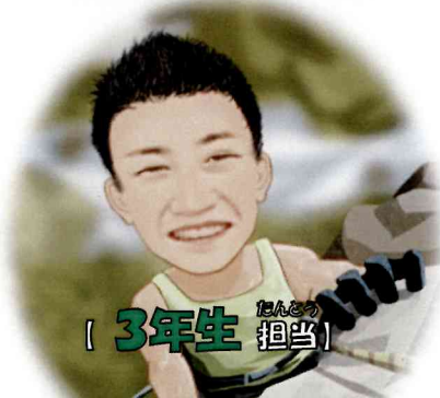
[ 3年生 担当 ]