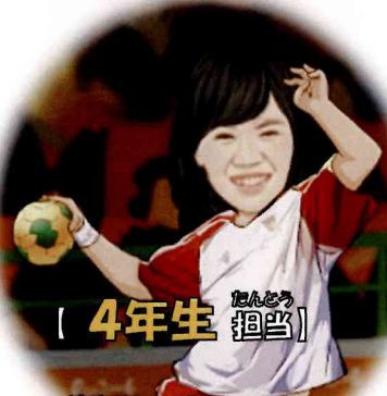
[ 4年生 担当 ]

はじめまして。5年生の担当になりました巽友花です。明るく元気に体を動かして、みなさんとたくさんお話ができたらと思います。