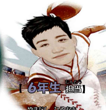
[ 6年生 担当 ]